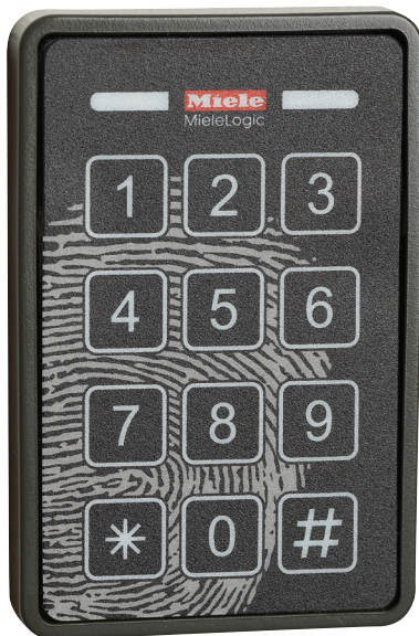
Tastatur til MieleLogic adgangskontrol