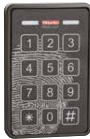
Tastatur til MieleLogic adgangskontrol