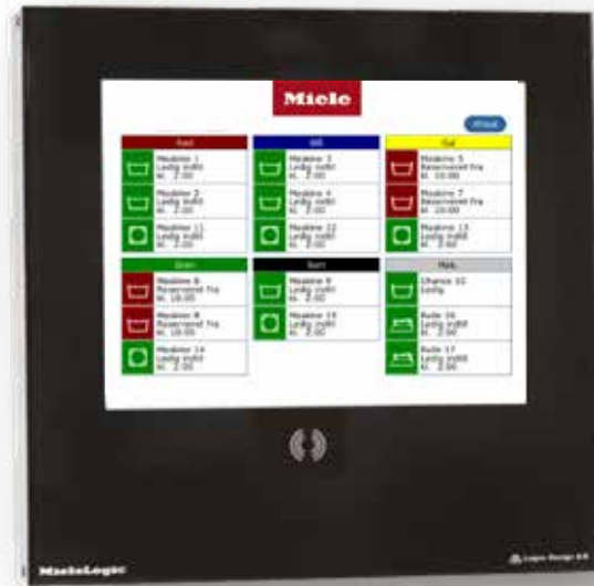
Monitor til selvbetjening i fællesvaskeriet